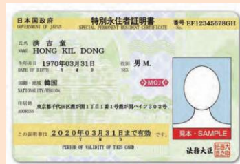
特別永住者証明書

そのほか、海技免状等国家資格を有することを証明する書類、 障害者手帳等福祉手帳、船員手帳、戦傷病者手帳、国または地方公共団 体の機関が発行した身分書(顔写真付)